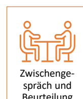
Abbildung 2: Aufgaben des Ansprechpartners/der Ansprechpartnerin in der Einrichtung