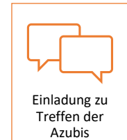
Abbildung 3: Langfristige Bindung von talentierten Schüler*innen (eigene Darstellung)